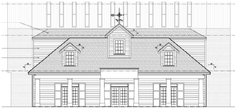
Le Rendez-vous de la Baie , un centre interprétatif acadien, sera situé dans l'édifice Louis-R.-Comeau de l'université Ste-Anne, à Pointe-de-l'Église.

Surveillez les mises à jour de ce projet dans notre prochain bulletin. ♦