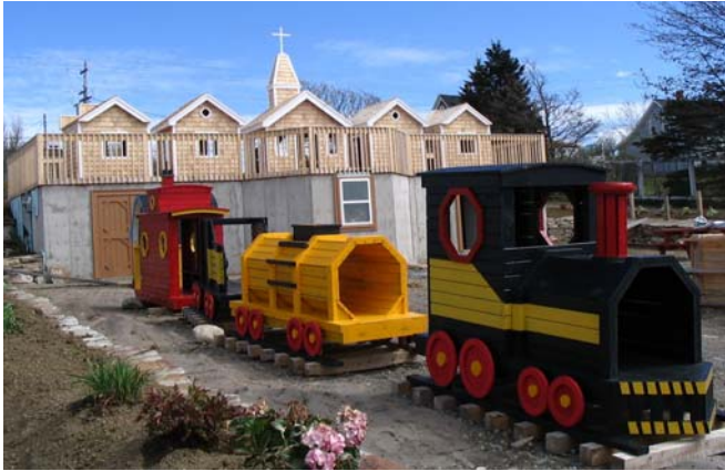
Un village miniature et un train en bois, la parfaite taille pour les tout-petits, sont quelques-unes des composantes du nouveau parc familial en plein air, maintenant ouvert, à Meteghan.