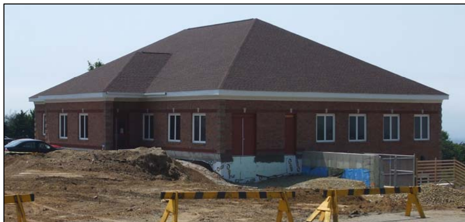
Le nouveau Centre de santé de Clare, construit à côté de l'ancien centre récemment démolit, situé à Centre-de-Meteghan, mesure 14 000 pieds carrés et rassemble une équipe de professionnels en santé.

Les 7000 pieds carrés de l'étage inférieur comprennent un espace pour le service de prélèvements sanguins, une aire d'attente, les bureaux des services de Santé publique, du Conseil communautaire de santé et des services en toxicomanie, ainsi qu'une salle de classe et une salle de conférences. Pour accéder aux services de prélèvements sanguins et les autres services de l'étage inférieur, veuillez stationner et entrer par la porte en arrière de l'édifice.